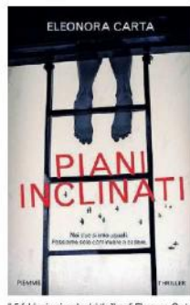
Il 5 febbraio si parla del thriller di Eleonora Carta

colo paese del Sud, contano l'uno sull'altro e condividono solitudini, povertà e frustrazione.